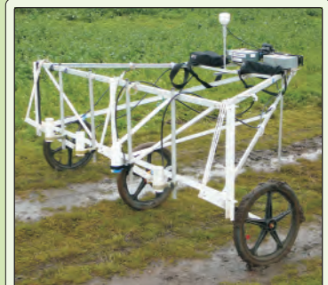
Wagen mit 4-fach Cäsium-Sensor